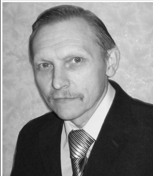
Я живу в пятиэтажке на Шоссейной №6. Избранный четыре года на-

зад по дому №2 депутат одновременно возглавляет зеленоградский участок жилищно-коммунального хозяйства. И мне непонятно, как при таком “счастливым” стечении обстоятельств можно было умудриться довести состояние дома до полного упадка. Течет крыша, затоплены фекалиями подвалы, подъезды не ремонтируются десятилетиями, трубы разваливаются от ветхости и заливают все вокруг, отмостки вдоль дома нет, лужи вокруг дома стоят целыми месяцами. В одну из зим (три года назад) мы чуть Богу душу не отдали из-за аварии системы отопления. И только благодаря звонку в МЧС наши коммунальные службы взялись за ликвидацию. И как всегда